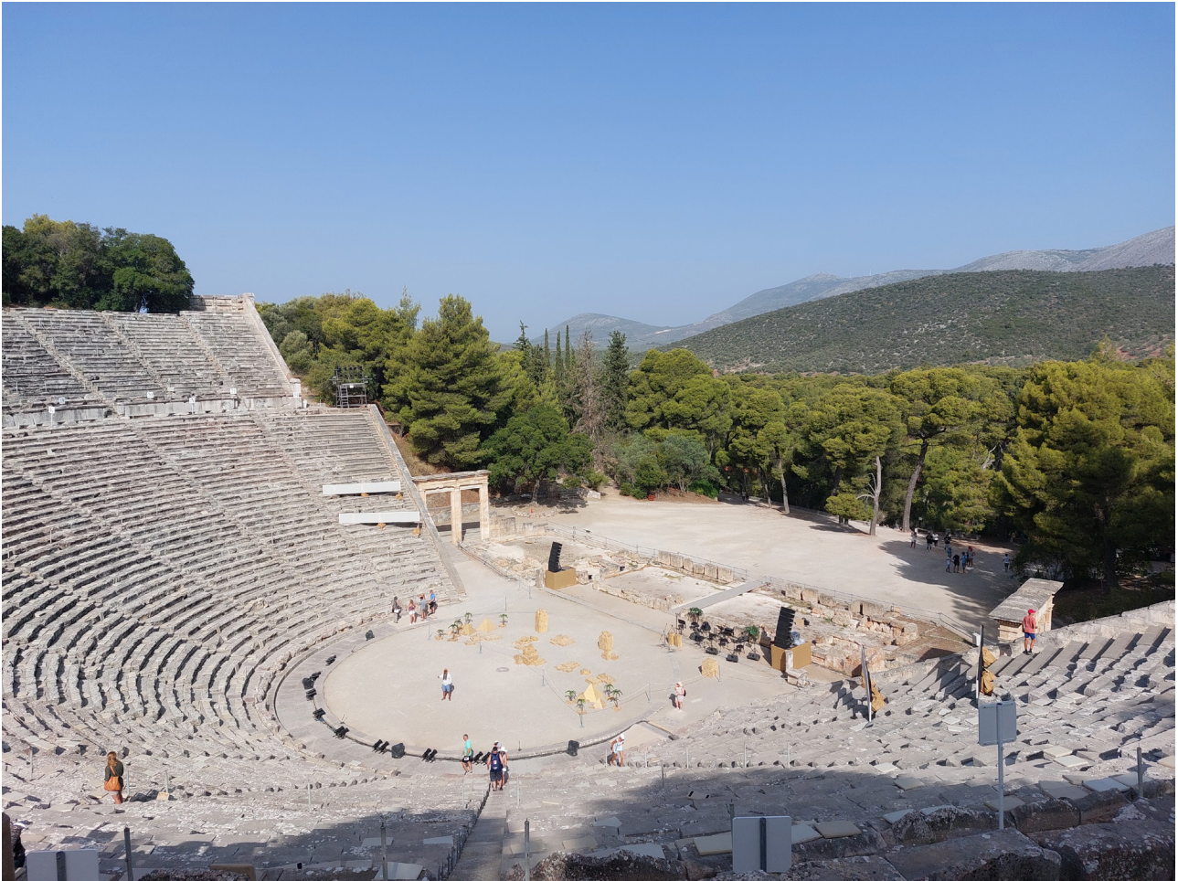
Het theater in het Asklepieion van Epidauros.

andere Asklepieia ook als ‘extra-urban’ bestempeld, zelfs als deze heiligdommen zich in een overduidelijk stedelijk gebied bevinden. Voorbeelden hiervan zijn Asklepieia die in de buurt van havens (Piraeus, Kenchreai, Lebena, Phalara, Antisara en Delos) en stadsmuren (Korinthe, Aliphera en Gortys) zijn gebouwd. 2 Hoewel deze heiligdommen zich vaak niet binnen de stadsmuren bevinden, doet hun omgeving wel degelijk stedelijk aan – en lijkt in niets op het afgelegen locatie van het Asklepieion van Epidauros.