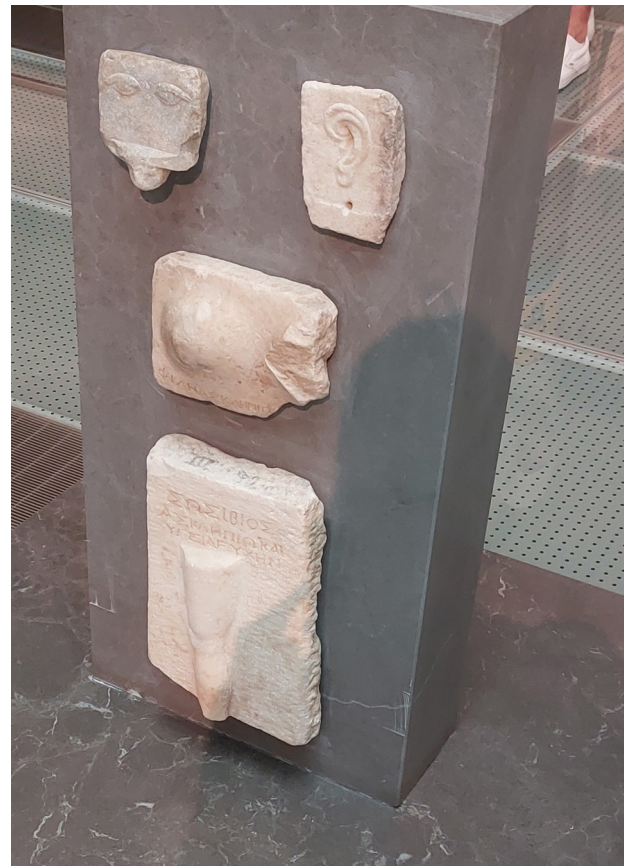
Anatomische votieven uit het Atheense Asklepieion (Acropolis Museum).

Een goed voorbeeld hiervan kan worden gevonden in de anatomische votieven die in grote aantallen zijn opgegraven in heiligdommen van Asklepios. Dat zijn votiefgeschenken in de vorm van ledematen die door patiënten werden geschonken aan