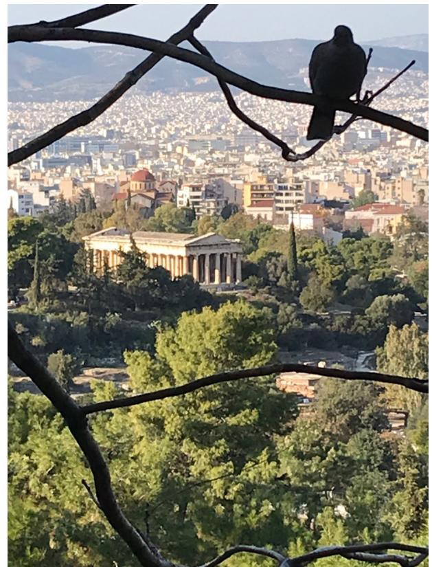
Rechts: uitzicht op de tempel van Hephaistos, aan de westkant van de Agora.