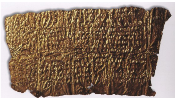
Orfishc tablet uit Hipponion, een Zuid Italiaanse polis. https://commons.wikimedia.org/wiki/File:Orphic_Gold_Tablet_(Hipponion-Museo_Archeologico_Statale_Capialbi,_Vibo_Valentia).jpg

In het religieuze landschap van Magna Graecia zijn (relatief) veel Demeter- en/of Persephone-heiligdommen te vinden. 4 Een daarvan is een van de grootste heiligdommen van Magna Graecia: de tempel van Persephone in Lokri. Hier is de godin een beschermster van vrouwen en huwelijken.