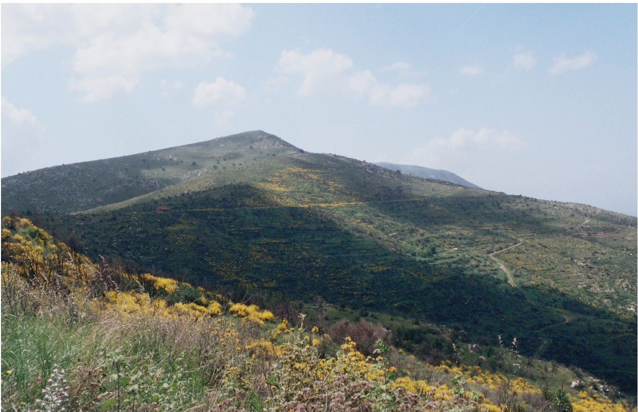
De heuvel van Theisoa.

Gert-Jan te Riele onderzocht in de jaren zeventig inscripties in Arkadië en stuitte daarbij op een vindplaats in het gehucht Tsouraki.