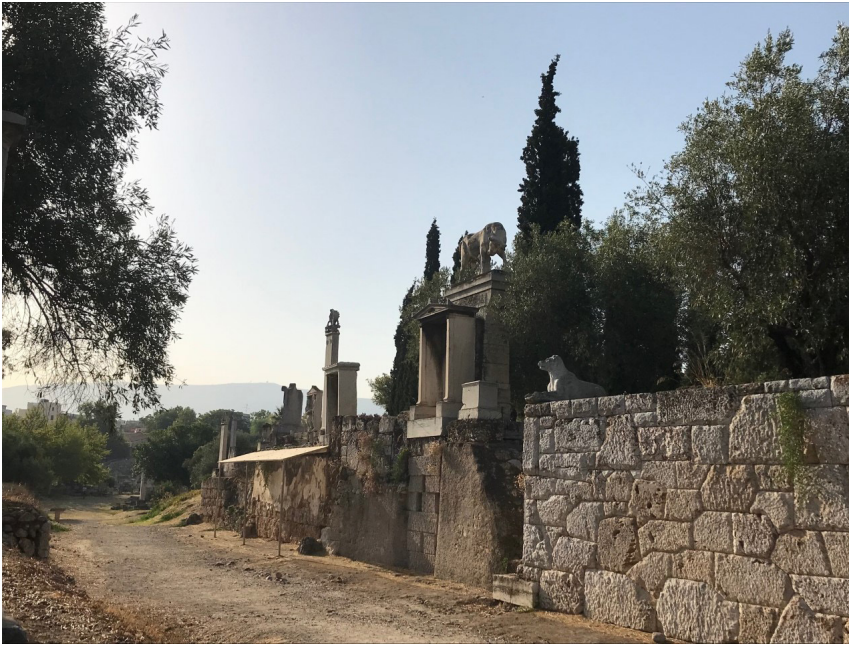
's Ochtends vroeg op de Kerameikos.