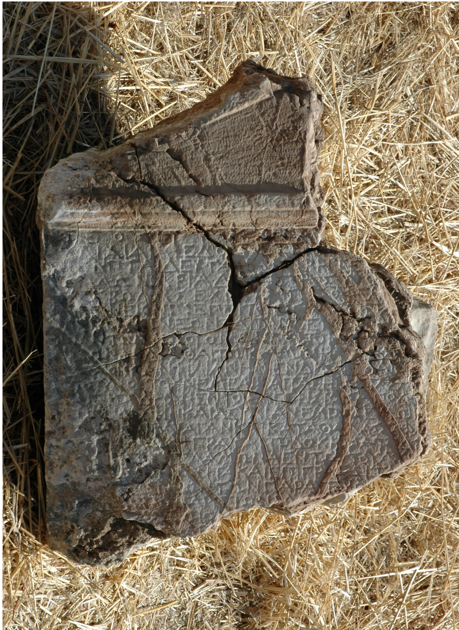
Antieke stèle met een inscriptie, Theisoa.