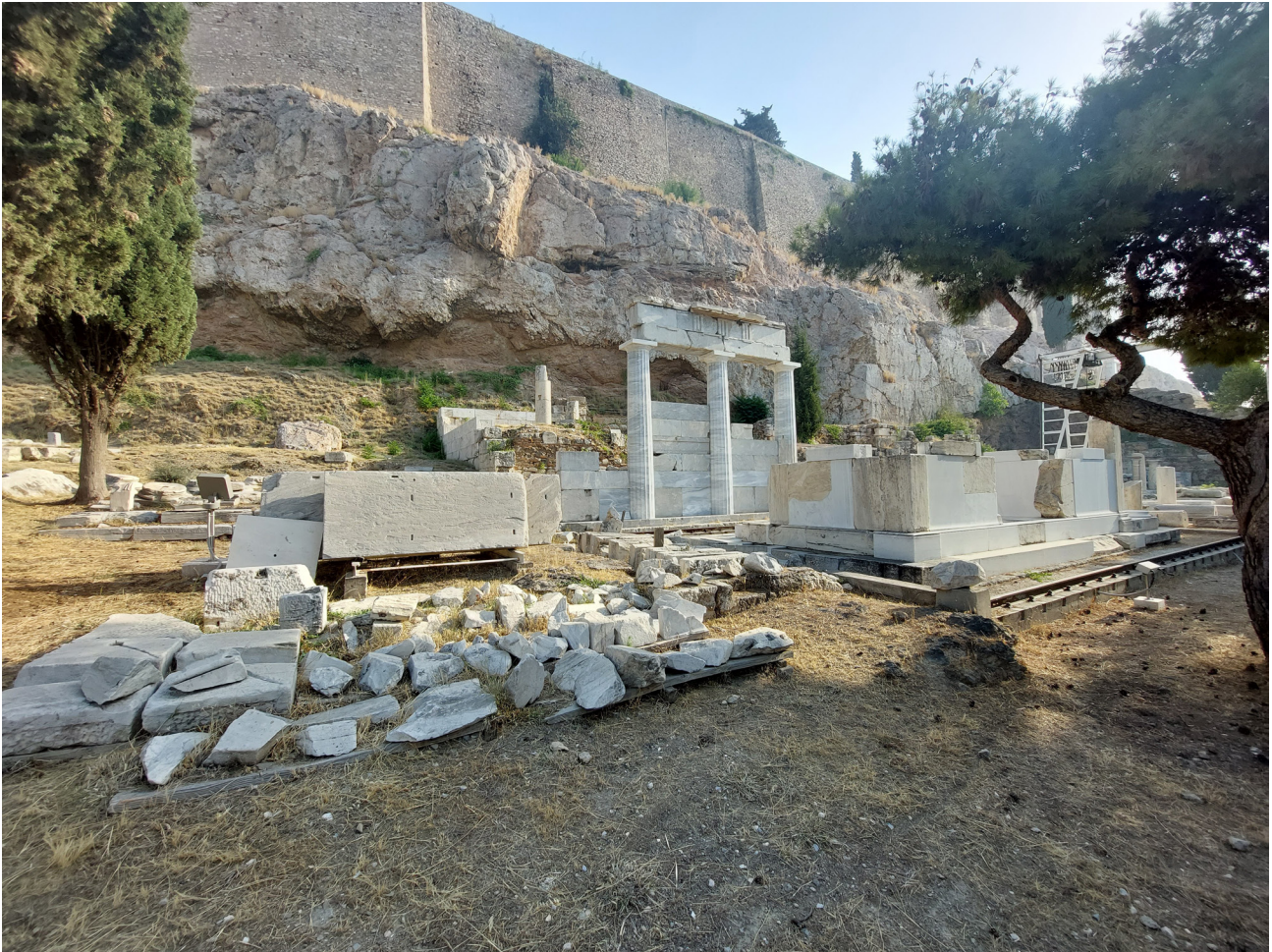
Het Asklepieion van Athene, op de zuidelijke zijde van de Akropolis.

verspreiding van de cultus van Asklepios wordt hierbij gekenmerkt als beïnvloed en gestuurd vanuit Epidauros, zonder dat dergelijke uitspraken worden onderbouwd met concreet bewijs. Daarom besloot ik deze aanname op de proef te stellen en te onderzoeken in hoeverre vroeg-Griekse Asklepieia (600-300 v.Chr.) het resultaat waren van Panhelleense processen van sociale en culturele verandering.