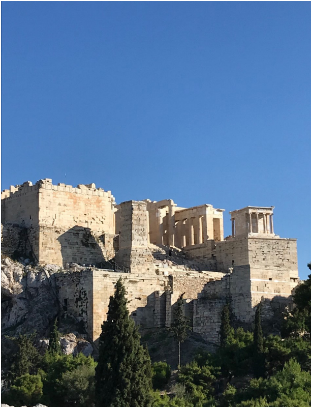
De toegang naar de Akropolis, met rechts de tempel van Nikè.

mogelijkheid krijgen om de opgedane kennis in een workshop in de praktijk te brengen. Dit alles overigens nog steeds onder voorbehoud.