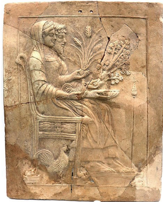
Kleitabiet gevonden in een Persephone-heiligdom in Locri, Zuid-Italië, waar zij duidelijk is afgebeeld als koningin van het hiernamaals. Ze is zelfs voor haar man Hades geplaatst.

Een groot aantal van de daar teruggevonden votieftabletten (van klei) laat een volwassen koningin van de onderwereld zien, soms in een meer prominente rol dan haar echtgenoot Hades. Meestal werden ze naast elkaar zittend afgebeeld, met Persephone aan de voorkant. 5 Andere kleitabietten tonen afbeeldingen die te maken hebben met het huwelijk en het leven van vrouwen. Hier wordt ze niet aangesproken als godin die over de reis naar de onderwereld gaat, zoals in Athene.