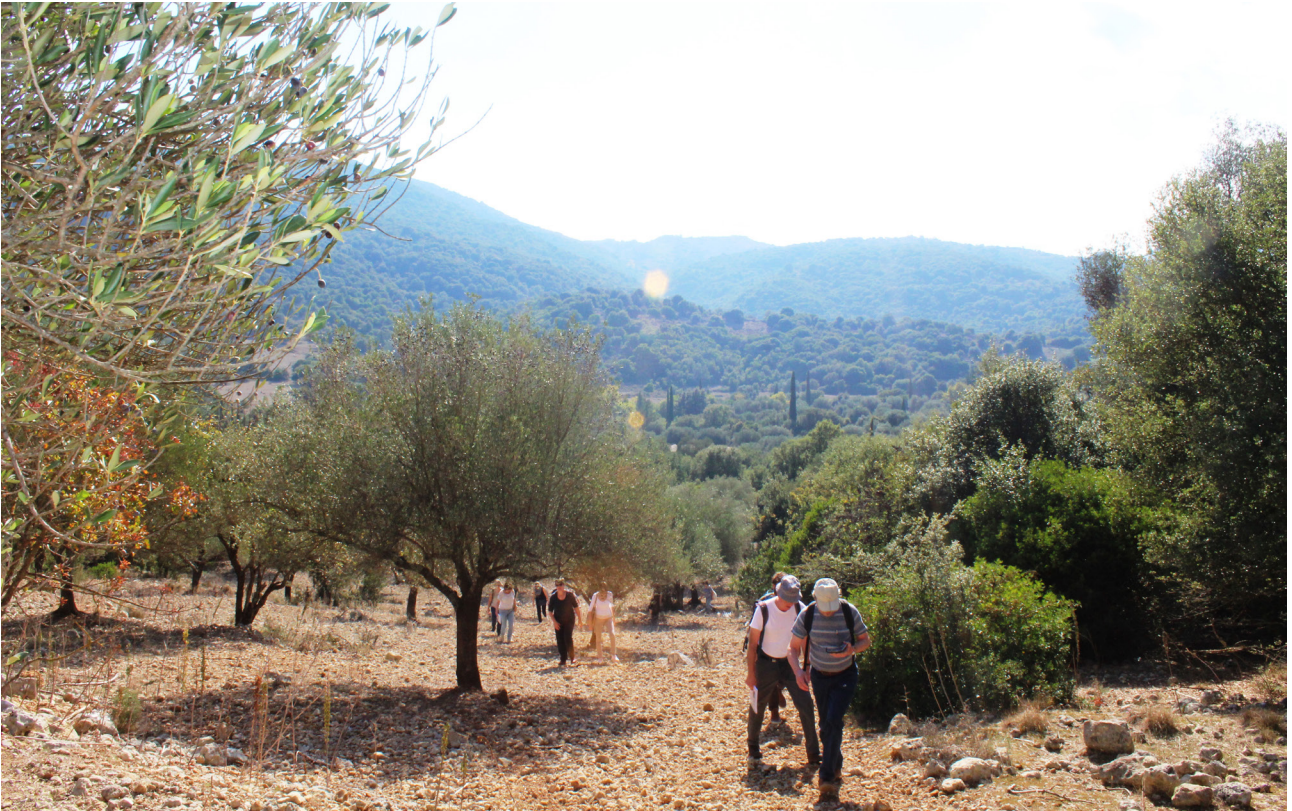
Poros, docenten op zoek naar het paleis van Odysseus.