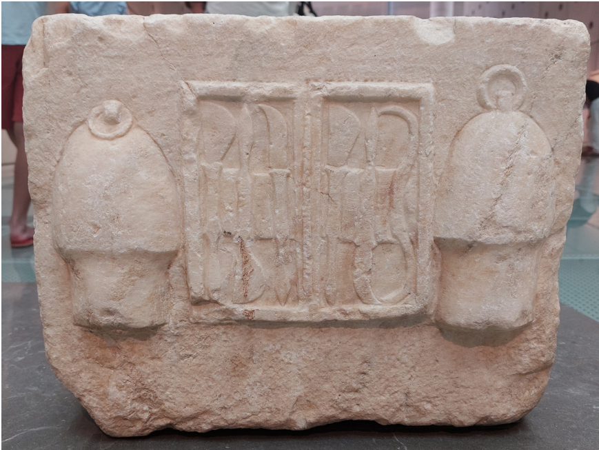
Scalpels en 'cupping'-instrumenten op een votief uit het Atheense Asklepieion. De 'cups' werden gebruikt om overtollige vloeistoffen uit het lichaam te verdrijven (Acropolis Museum).

Asklepios in de hoop dat de god het afgebeelde lichaamsdeel zou genezen. Omdat die votieven een gemeenschappelijk doel dienden was het opdragen van lichaamsdelen aan Asklepios in wezen een Panhelleense praktijk, hoewel dit gebruik in werkelijkheid allesbehalve consistent was.